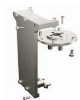
マウントブラケット/本体回転防止ブラケット