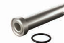
ノズル/Oリングキット